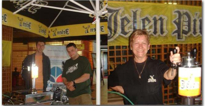
Apatinska pivara zaslužna za dobro raspoloženje

Pomenutim entuzijastima uručene su majice Apatinske pivare kao nagrada za uloženi trud.